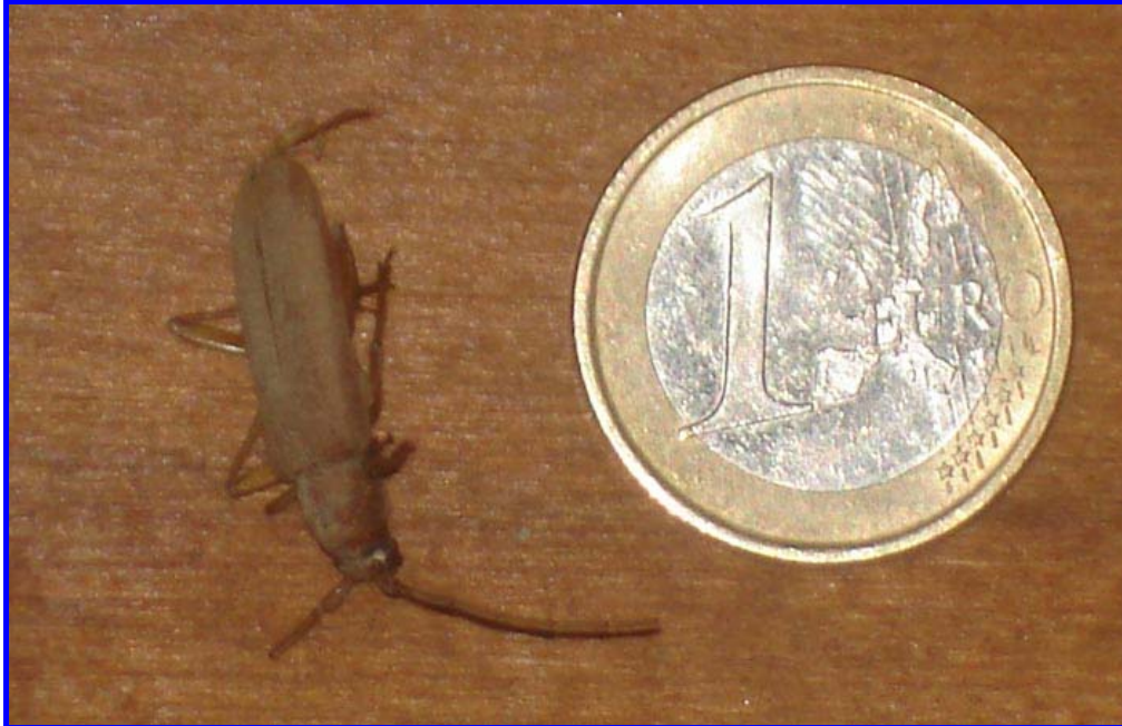
Ejemplar adulto de cerambcícido ( Hylotrupes bajulus )