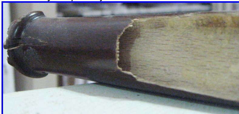
Las galerías se confunden erróneamente con las de termitas