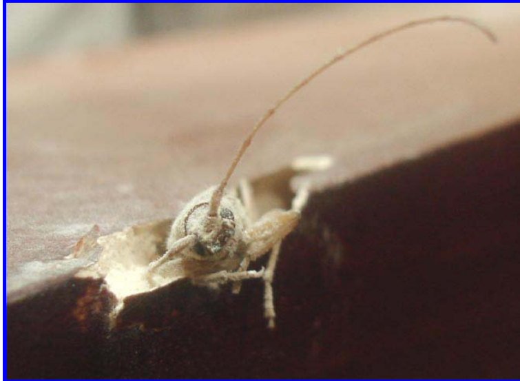
Un Hylotrupes bajulus saliendo de la madera