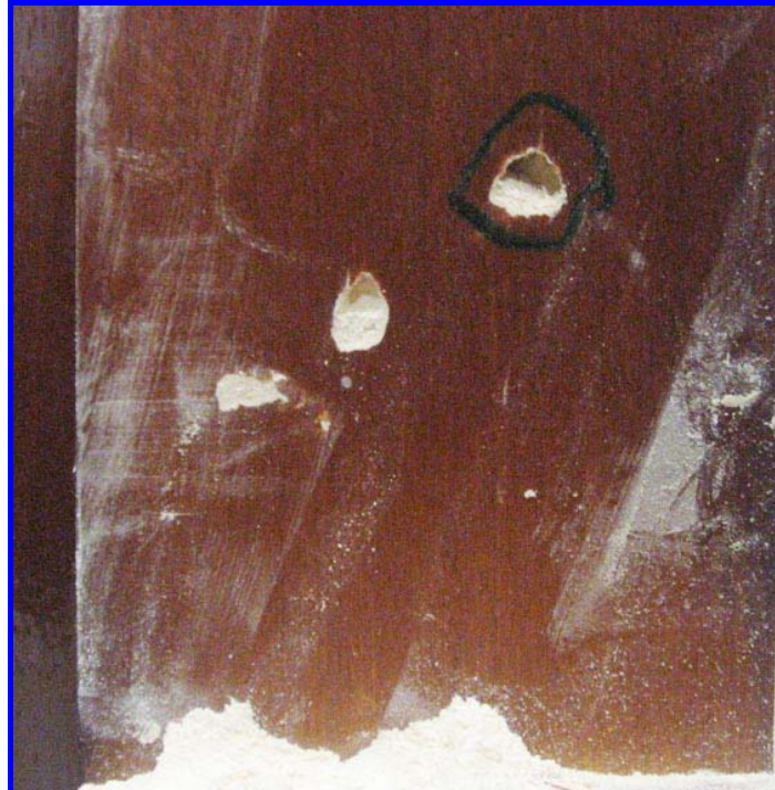
Aspecto superficial y serrín de los cerambícidos