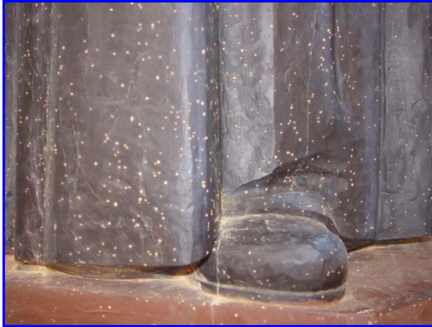
Serradures (excrements) característiques dels anòbids