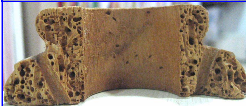
Aspecte superficial i estat intern de la fusta