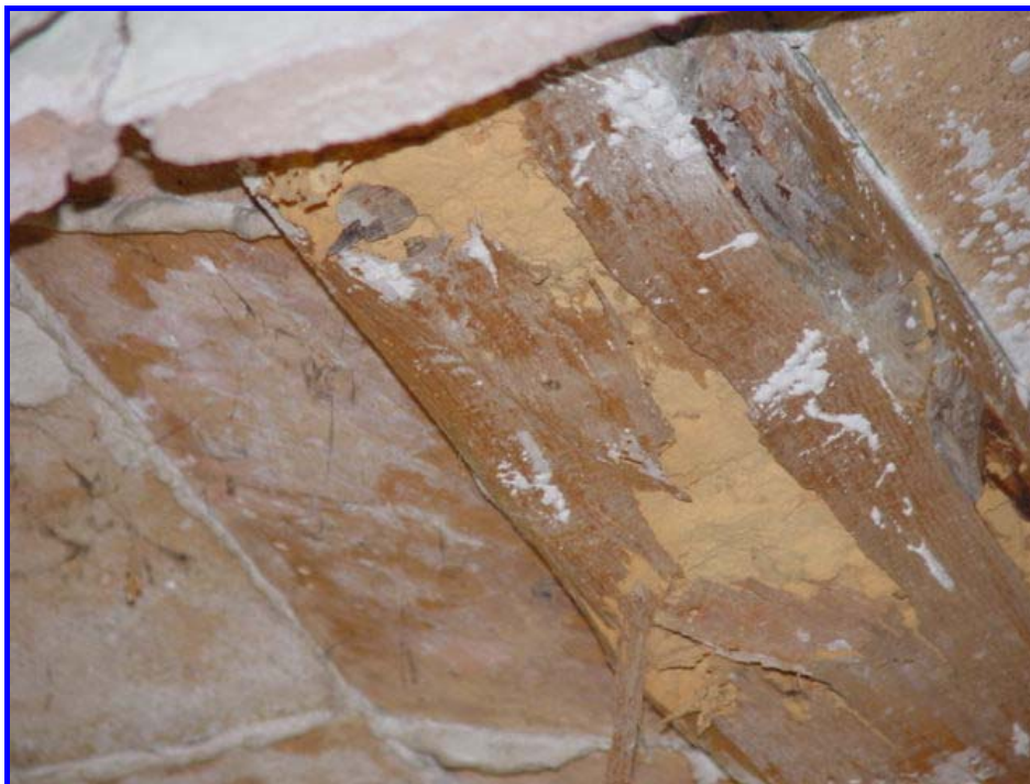
A menudo los daños no se detectan hasta tocar los elementos o escuchar a los insectos comiendo o con la visión de los agujeros de salida