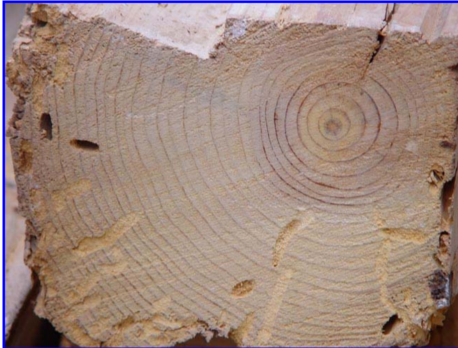
Los cerambícidos pueden afectar el corazón de las vigas, dañando gravemente los elementos